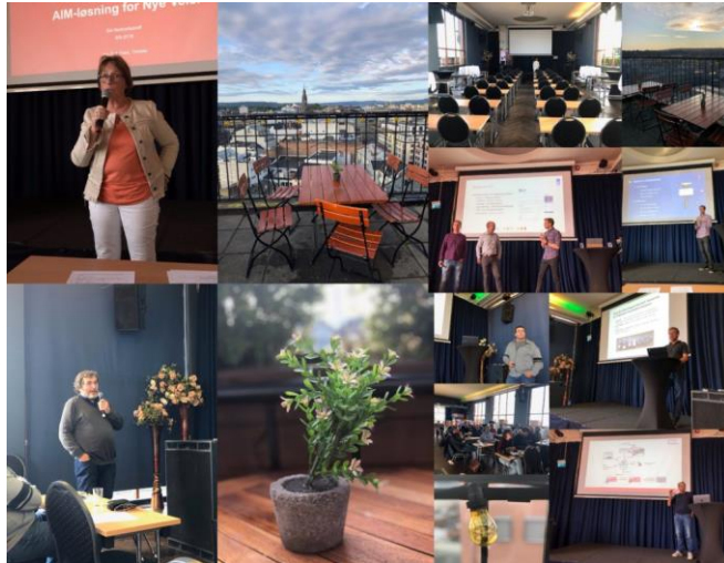
Illustrasjon BA-Nettverket. Stemningsrapport fra et nettverkstreff. Tungt faglig innhold, flinke deltakere, hyggelig stemning og god dialog på tvers av fag og roller.

Vi arrangerer «hele tiden» nettverkstreff, fysisk eller på Teams for å spre informasjon og engasjement. Vi tilstreber åpenhet, og de fleste arrangement er åpne for alle.